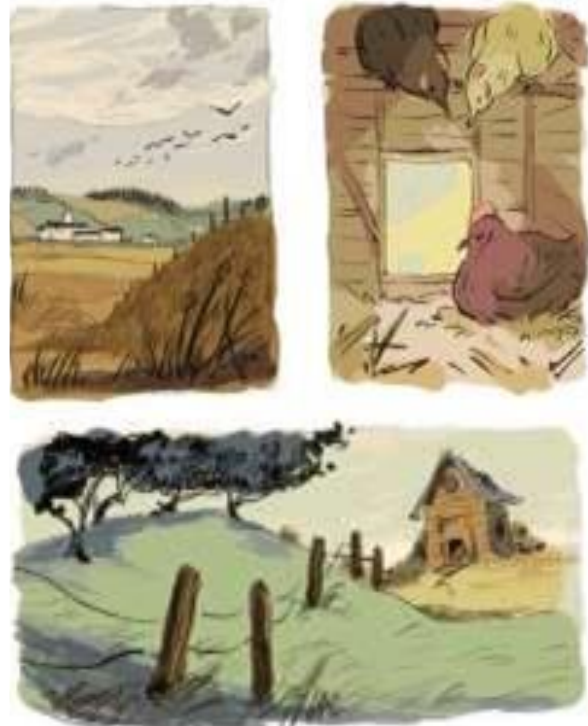
Illustration Visual Style