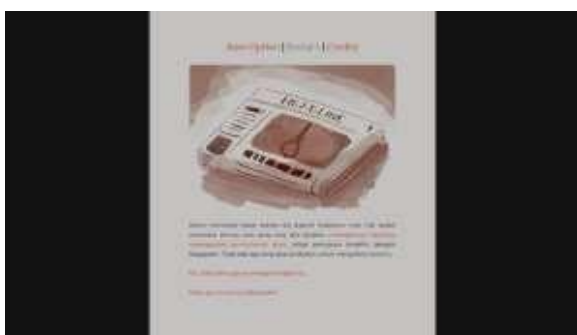
Gambar 10. Contoh implementasi ilustrasi pendukung media pembelajaran