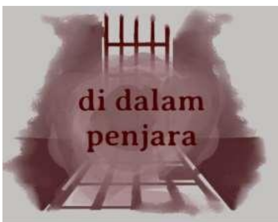
Gambar 9. Ilustrasi yang digunakan dalam title card