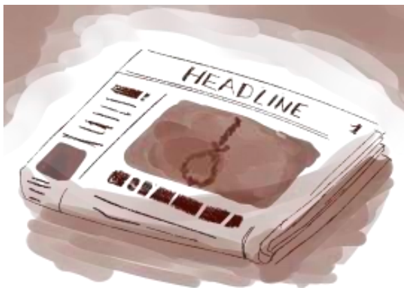
Gambar 8. Contoh hasil akhir ilustrasi pendukung media pembelajaran