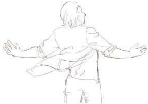
Gambar 5. Contoh sketsa ilustrasi pendukung media pembelajaran