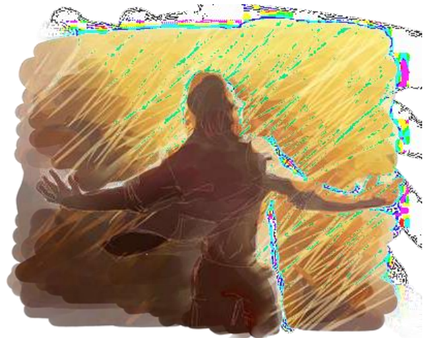
Gambar 7. Contoh hasil akhir ilustrasi pendukung media pembelajaran