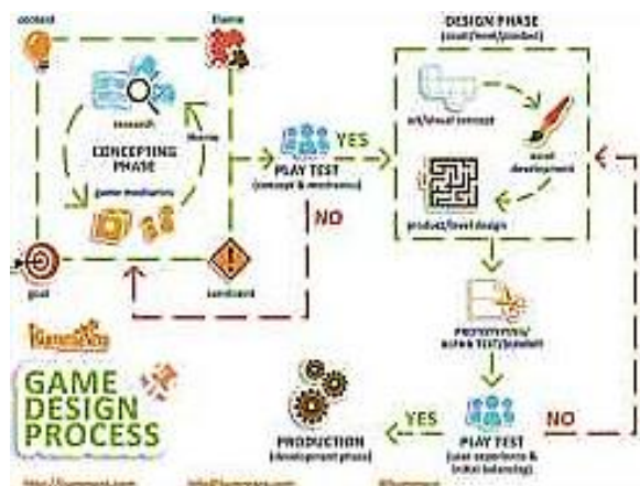
Gambar 2. Game Design Process

Proses perancangan card game yang dilakukan meliputi beberapa fase yang perlu dilakukan dalam merancang sebuah game . Perancangan dilakukan berdasarkan game design process oleh Eko Nugroho, CEO Kummara, perusahaan yang bergerak di bidang serious game design and development, game based learning, dan gamification . Game design process dapat dilihat pada Gambar 2.