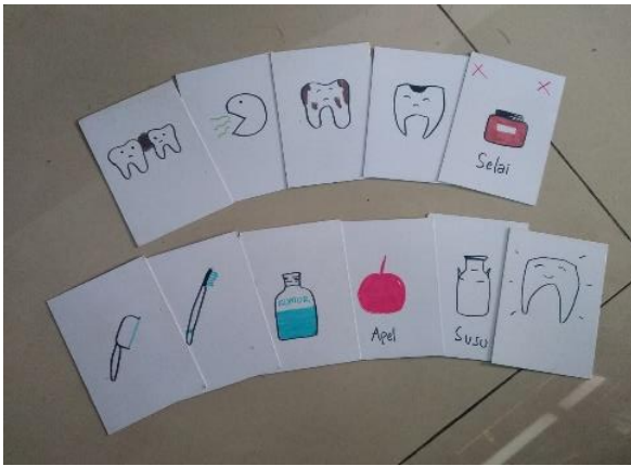
Gambar 3. Design phase dan prototyping

game dan atau card game . Teman yang melakukan playtest menganggap bahwa mekanik sudah cocok dan menarik untuk dimainkan, tetapi ada beberapa komponen yang bisa diubah agar pemain bisa mendapat pengetahuan lebih. Makanan dan minuman disarankan agar dibuat lebih banyak variasi agar tidak membosankan dan bisa memberitahu anak lebih banyak lagi. Balancing jumlah kartu juga perlu diperhatikan kembali. Tahapan dari design phase dan prototyping dapat dilihat pada Gambar 3.