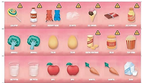
Gambar 4. Kartu makanan dan minuman

membedakan dengan jelas mana makanan atau minuman yang buruk. Contoh kartu makanan dan minuman bisa dilihat pada Gambar 4.