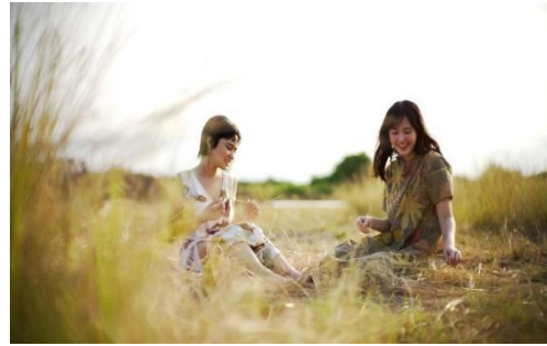
Gambar 3. Kedua model ketika memperagakan adegan saat pengambilan gambar