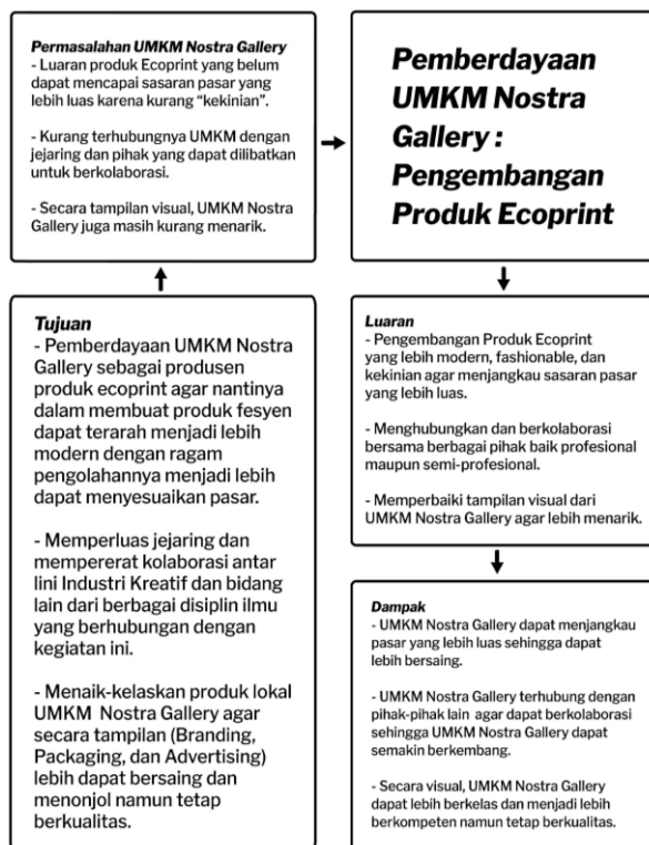
Gambar 1. Penjelasan alur sistem pemberdayaan dalam program ini

Sehingga, langkah yang dianggap paling efektif dari penyelesaian masalah di atas adalah dengan memberikan edukasi tentang pentingnya kolaborasi dan pergerakan fashion modern yang kemudian dilanjutkan dengan pengembangan produk ecoprint yang lebih menarik, modern, kekinian, fungsional, dan memiliki nilai jual tinggi. Pengembangan produk ecoprint menjadi fokus utama dikarenakan luaran produk dari olahan ecoprint masih belum terlalu banyak diminati dan belum dapat menjangkau pasar yang lebih luas, sehingga diharapkan dari pengembangan produk ini dapat memperluas dan menjangkau sasaran pasar UMKM Nostra Gallery ini.