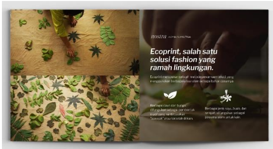
Gambar 7. Penjelasan tentang ecoprint di dalam katalog