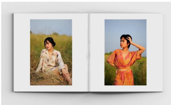
Gambar 8. Foto model yang telah mengenakan luaran fashion ecoprint baru di dalam katalog