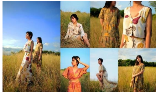
Gambar 4. Kompilasi hasil pemotretan model yang mengenakan luaran fesyen ecoprint hasil kolaborasi