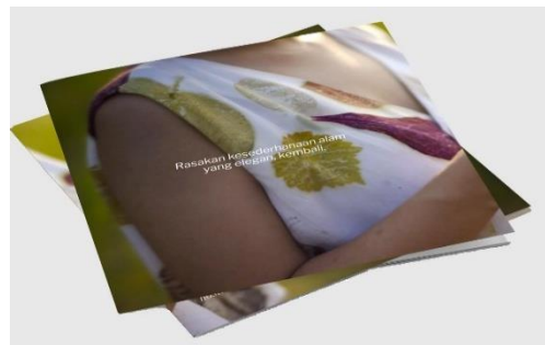
Gambar 6. Potret halaman belakang katalog tampilan baru dari UMKM Nostra Gallery