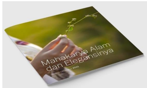
Gambar 5. Potret halaman depan katalog hasil desain tampilan baru dari UMKM Nostra Gallery dan luaran produk ecoprint -nya