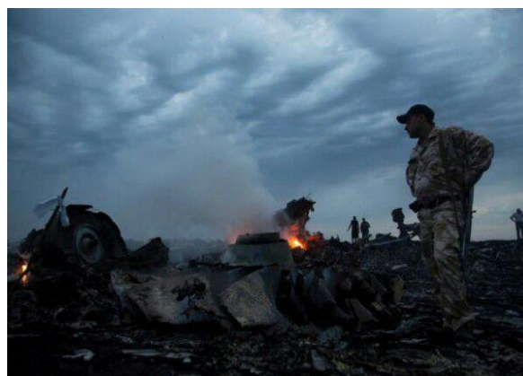
Gambar 1. Foto karya kontributor AP Photo, Dmitri Lovetsky saat belum memasuki proses editing atau masih di web AP Photo.

Karya foto milik kontributor AP Photo, Dmitri Lovetsky yang secara realis gambang memotret seorang petugas keamanan yang mengawasi sisa-sisa puing pesawat MH-17 dengan latar belakang sinar matahari yang redup dan cenderung low light , dapat oleh redaktur The Times disulap menjadi terang benderang dan langit menjadi biru bergelombang seperti editing salon foto yang terlihat sangat mengedepankan unsur keindahan daripada unsur realitas. Realitas foto jurnalistik terlihat flamboyan jika mengedepankan unsur keindahan dan dramatisasi objek akan tetapi tidak memperhatikan batasan-batasan editing dengan dasar realitas kejadian sebenarnya di lapangan.