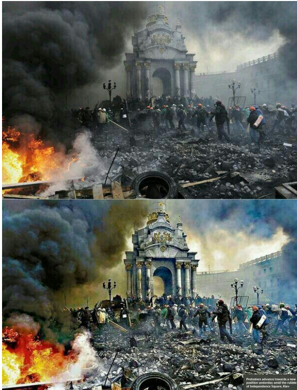
Gambar 4.