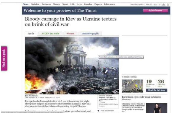
Gambar 5. Foto karya kontributor AFP / Getty Images, Louisa Gouliamaki. yang sudah tayang di portal berita The Times. Gambar sudah memasuki proses editing dengan penambahan level dan kontras

Foto yang dilatarbelakangi oleh gejolak masyarakat dan berdampak pada kerusuhan memang tidak mudah untuk disajikan, satu sisi pewarta foto ingin menampilkan nilai dramatisasinya dengan memotret korban dan momen-momen tindak penganiayaan dari aparat pada demonstran, sisi lain pewarta foto ingin menampilkan sisi etika dan kemanusiaannya dengan tidak menampilkan foto yang berdarah-darah walaupun merupakan realitas sebenarnya di lapangan. Foto yang baik adalah sebuah karya visual yang dapat membangkitkan emosi khalayak yang melihatnya tanpa tidak melebih-lebihkan atau mengurangi unsur realitas yang ada.