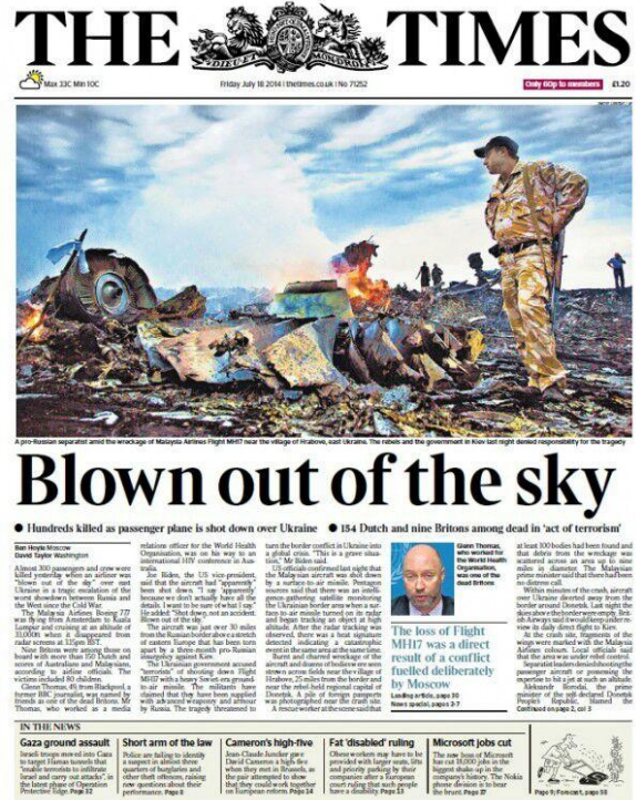
Gambar 3. Foto karya kontributor AP Photo, Dmitri Lovetsky yang dimuat dalam edisi cetak The Times. Gambar sudah mendapatkan banyak proses editing berbeda dari warna aslinya

tidak berada pada proses editing akan tetapi unsur realitas yang ada. Kamera dan pewarta foto diharapkan menjadi wakil atau mata para konsumen media yang tidak bisa melihat langsung realitas sebenarnya di lapangan untuk dihadirkan dalam medium fotografi jurnalistik.