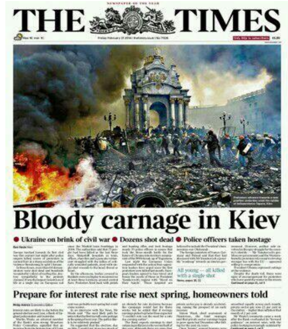
Gambar 6. Foto karya kontributor. AFP / Getty Images, Louisa Gouliamaki yang dimuat dalam edisi cetak The Times. Gambar sudah mendapatkan banyak proses editing berbeda dari warna aslinya