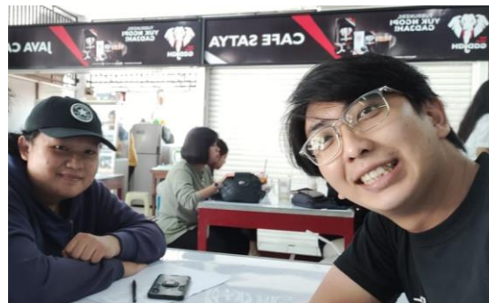
Gambar 5. Validasi game Freshmen bersama pakar game

dipermasalahan, untuk panduan bermain disarankan untuk disingkat lagi agar pemain dapat langsung memainkan game tanpa basa basi mengingat waktu fokus yang dimiliki siswa dalam bermain game juga terbatas. Ukuran tombol pada game disarankan untuk dikecilkan dan dibuat transparan karena dapat menutupi karakter yang dikendalikan oleh pemain. Cerita yang dikembangkan untuk game Freshmen terbilang sudah bagus jika ingin digunakan sebagai media hiburan akan tetapi untuk kebutuhan penelitian sebaiknya cerita diubah menjadi cerita singkat dan lebih fokus kepada materi pembelajaran yang akan disuguhkan ke dalam game . Dokumentasi evaluasi pada siswa dapat dilihat pada Gambar 5.