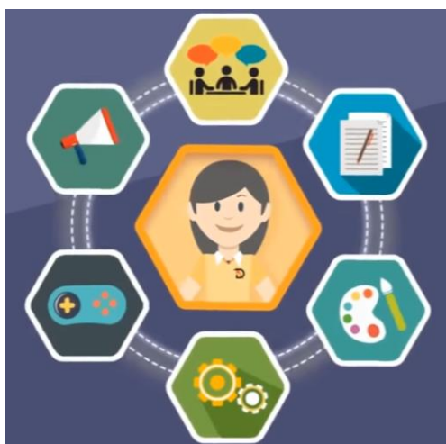
Gambar 2. Proses pembuatan game visual Digital Artha

Pada tahap ini game visual novel dirancang. Aspek permainan seperti jalan cerita dan pilihan jalan cerita disesuaikan agar informasi berupa edukasi dapat disampaikan kepada target audience . Perancangan dibuat berdasarkan proses pembuatan game visual dari Digital Artha selaku Digital Creative Agency di Indonesia. Terdapat 6 tahap dalam pembuatan game visual novel , yaitu menentukan konsep cerita, proses pembuatan cerita, graphic design , finishing , proses testing game , dan proses publishing (Digital Artha, 2018). Dikarenakan game ini dirancang untuk penelitian maka hanya akan dibuat hingga tahap testing . Proses pembuatan game dari Digital Artha dapat dilihat pada Gambar 2.