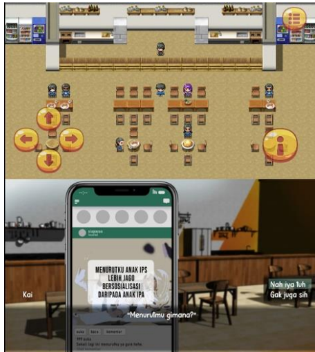
Gambar 4. Area permainan dan percakapan di game Freshmen

Gambar 3 menunjukkan tampilan menu utama yang dibuat menggunakan latar belakang gambar sekolah tempat pemain akan memainkan game Freshmen dan panduan bermain game Freshmen . Pada perancangan awal panduan dibuat lebih panjang dengan menjelaskan langkah demi langkah. Panduan bermain kemudian dipotong durasinya dengan hanya menunjukkan gambar petunjuk cara bermain dengan penjelasan singkat dikarenakan siswa SMA rata-rata sudah sering dan paham cara memainkan game dan cara bermain game Freshmen juga tidak jauh berbeda dengan game pada umumnya yang ada di pasar.