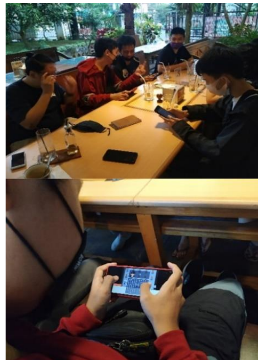
Gambar 7. Evaluasi game Freshmen bersama siswa SMA

Berdasarkan data pada Tabel 2 dapat disimpulkan bahwa evaluasi yang diberikan siswa sangat baik dan dapat membantu siswa memahami etika dalam bermedia sosial. Dokumentasi evaluasi game pada saat pengujian bersama siswa dapat dilihat pada Gambar 7.