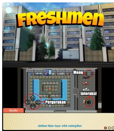
Gambar 3. Tampilan menu utama dan panduan game Freshmen

Tahap perancangan, game dibuat untuk platform android berdasarkan data pada tabel 2. Dikarenakan batas waktu pengujian game yang terbatas maka game tidak dapat diujikan secara penuh. Maka dikembangkan Demo yang dapat diselesaikan dalam waktu singkat. Premis cerita dari game adalah sebagai berikut. Tokoh utama baru saja diterima menjadi siswa di SMA setelah lulus dari SMP. Akan tetapi dia memiliki kenangan yang tidak berkesan semasa SMP akibat perundungan. Maka sang tokoh berusaha untuk lebih berhati-hati dalam menjalin relasi di masa SMA. Pemain akan bermain sebagai tokoh utama dan menjalani masa awal SMA atau Freshmen yang merupakan judul untuk game yang dirancang. Nuansa eksplorasi juga ditambahkan ke dalam game agar membuat game tidak terkesan monoton hanya dengan membaca teks cerita. Berikut merupakan screenshot dari demo game yang sudah dikembangkan. Menu utama game dan panduan bermain dapat dilihat pada Gambar 3, contoh salah satu area di dalam game dan contoh percakapan yang melibatkan pilihan dilihat pada Gambar 4.