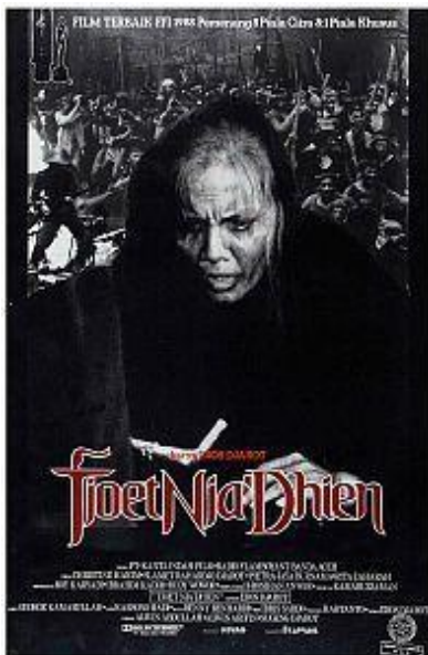
Gambar 1. Poster Film “Tjoet Nja Dhien”

Pendalaman paling signifikan terdapat pada tingkat thirdness , yaitu analisis ideologis terhadap tanda sebagai legisign yang bekerja dalam konvensi budaya tertentu. Poster film tidak hanya merepresentasikan karakter perempuan, tetapi turut memproduksi mitos visual tentang perempuan dalam sinema Indonesia. Meskipun poster Marlina dan Yuni menghadirkan perempuan sebagai subjek resistensi, visualnya masih membingkai perempuan sebagai figur kesepian dan individual dalam menanggung beban perjuangan. Hal ini menunjukkan ambivalensi ideologis, di mana resistensi hadir namun tetap berada dalam estetika penderitaan. Dengan demikian, poster film berfungsi sebagai artefak desain komunikasi visual yang menjadi ruang negosiasi ideologis antara feminisme, patriarki, dan nilai budaya dominan.