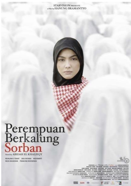
Gambar 2. Poster Film “Perempuan Berkalung Sorban”

Pendalaman lebih lanjut menunjukkan bahwa oposisi visual dalam poster ini tidak hanya bekerja pada bentuk, tetapi juga pada temporal dan psikologis. Annisa ditampilkan menghadap langsung ke penonton, seolah keluar dari arus waktu kolektif yang direpresentasikan oleh deretan perempuan di belakangnya. Perempuan-perempuan yang menunduk dan seragam tampak seperti massa tanpa identitas individual, sementara Annisa hadir sebagai subjek yang “terjaga” dan sadar. Dalam kerangka Peirce, relasi ini memperkuat fungsi secondness sebagai pengalaman benturan antara individu dan struktur sosial. Tatapan Annisa bukan sekadar ekspresi keberanian, tetapi penanda momen kesadaran kritis saat subjek menyadari ketidakadilan sistem dan mulai mengambil jarak darinya. Poster ini dengan demikian mbingkai perlawanan perempuan sebagai proses internal yang sunyi namun menentukan, bukan sebagai aksi heroik yang spektakuler.