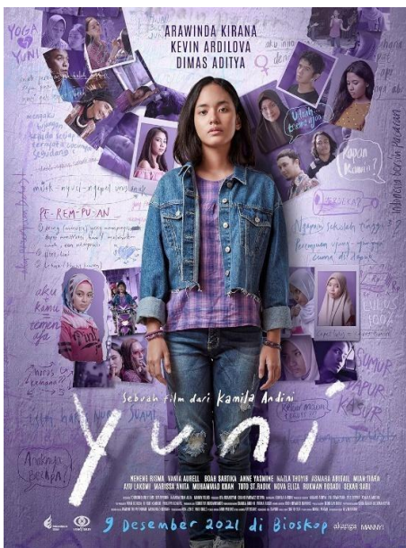
Gambar 5. Poster Film “Yuni”

Dalam konteks historis-kultural Indonesia pasca-2010-an, poster Penyalin Cahaya merefleksikan meningkatnya kesadaran publik terhadap isu kekerasan seksual di lingkungan kampus, bersamaan dengan masih kuatnya budaya bungkam dan hierarki institusional. Visual modern seperti mesin fotokopi dan pencahayaan elektrik merepresentasikan dunia akademik yang secara ideologis mengklaim rasionalitas dan objektivitas, namun secara praksis sering gagal melindungi korban. Dengan demikian, poster ini tidak hanya merepresentasikan cerita film, tetapi menjadi artefak desain komunikasi visual yang merekam ketegangan antara modernitas dan ketidakadilan, antara klaim kebenaran dan pengalaman traumatis perempuan yang terus dipertanyakan.